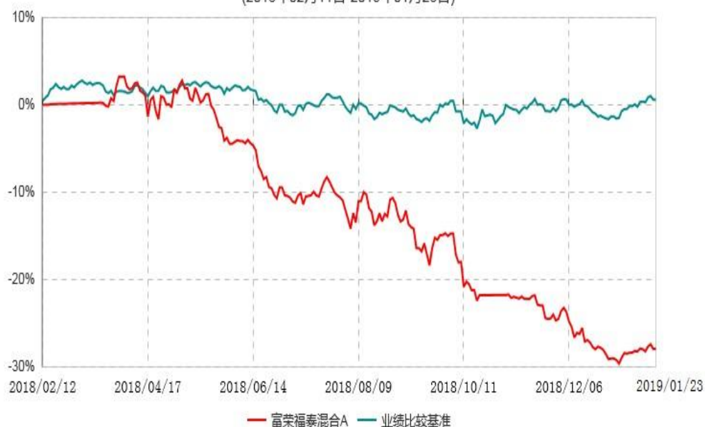
富荣福泰混合C累计净值增长率与业绩比较基准收益率历史走势对比图