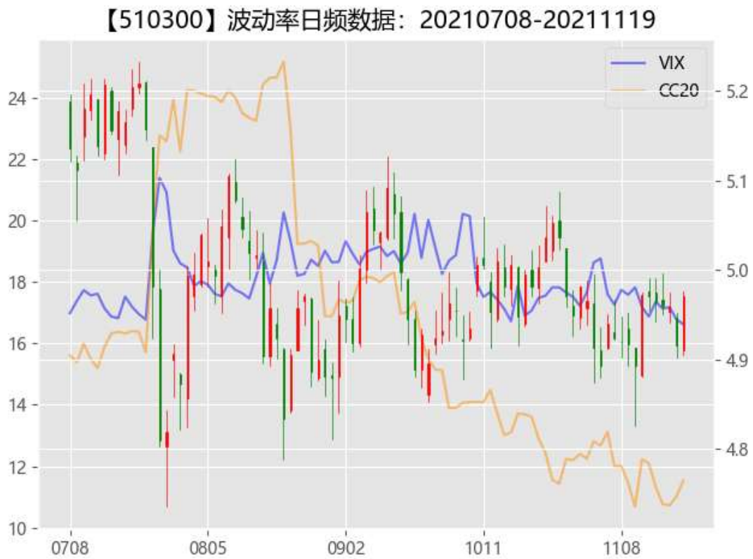
图 2：期权市场隐含波动率

净流入 111.83 亿，其中沪股通流入 0.46 亿，深股通流入 111.37 亿。现货市场窄幅震荡下，沪深 300、上证 50 隐含波动率继续大幅度回落。近期可能引发冲击的事件纷纷落地，风险指标进一步下降，预计市场在本周将会震荡上行。另外，投资者要特别小心市场可能出现方向快速选择进而引发一波震荡，期权市场投资者谨慎卖空波动率。