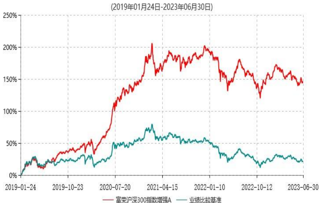
富荣沪深300指数增强A累计净值增长率与业绩比较基准收益率历史走势对比图