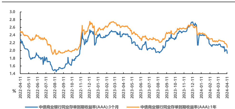
图2、存单二级收益率