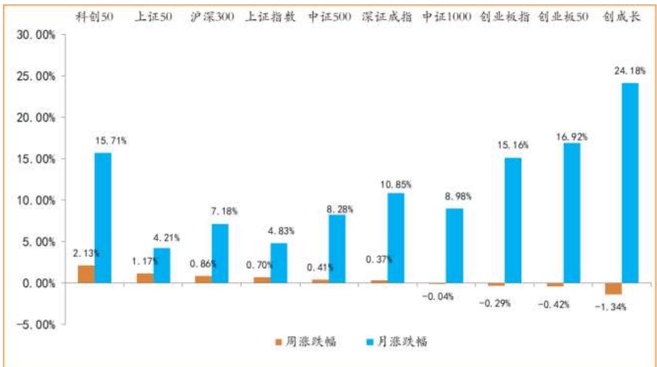
图：主要股指周度/月度涨跌幅（单位：%）

周涨跌幅统计区间：20260420-20260424；月涨跌幅统计区间：20260401-20260424